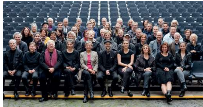
> Ensemble 2015