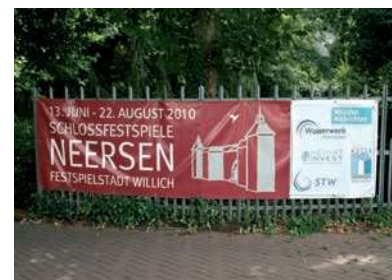
> Tribüne Rückseite > Transparent > Premierengeschenk: Pralinendose (oben)