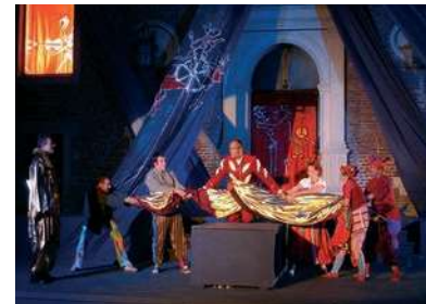
> Ensemble Spielzeit 1984 > „Der zerbrochne Krug“ (1984) > „Jedermann“ (2005)

Heute sind die Schlossfestspiele Neersen für Willich – kulturell gesehen – die ganz große Attraktion. Viele tausend Menschen füllen seit 1984 Jahr für Jahr die Ränge im Innenhof des Schlosses. Dabei ist stets beste Unterhaltung für alle Altersgruppen garantiert! Ob Hotzenplotz oder Drama, Puppenspiel oder Nathan der Weise, ob Madrigale oder Operngala, Märchen oder Gegenwartsstück – wenn die Festspiele rufen, dann kommen kleine und große Besucher, um tolles Theater zu erleben und um das ganz besondere Flair rund um das in einem herrlichen Park gelegene, historische Schloss zu genießen.