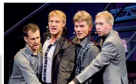
> „Pünktchen und Anton“ > „Opa wird verkauft“ > Die Schmachtigallen