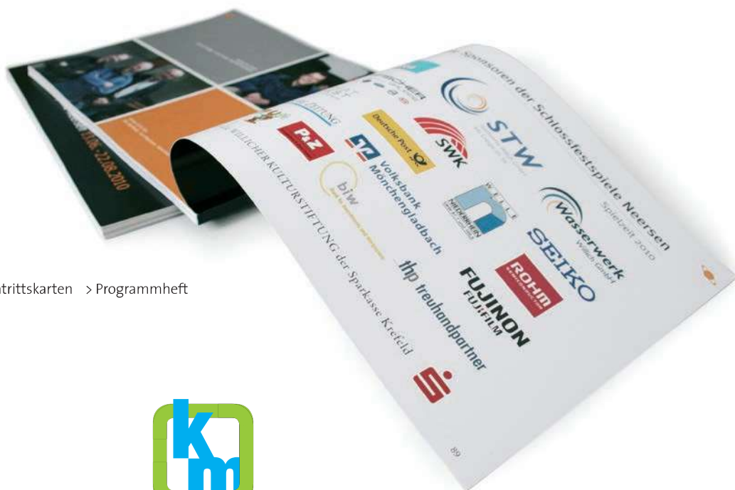
> Eintrittskarten > Programmheft